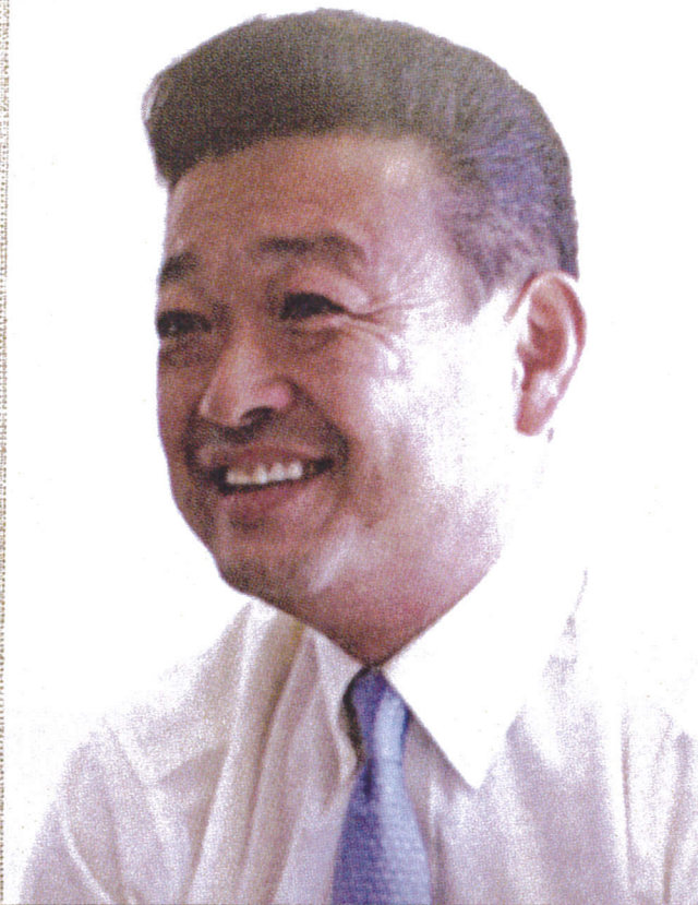
有限会社リビング館ホンダ 社長